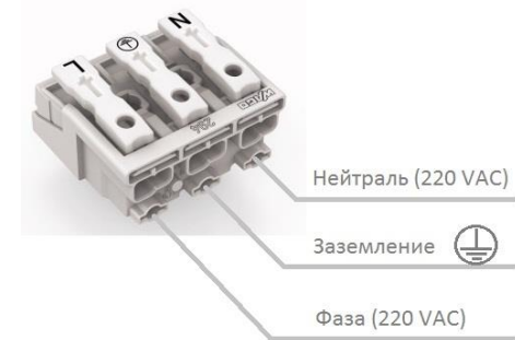
Рисунок 2 Схема подключения светильника