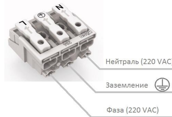
Рисунок 2 Схема подключения светильника

5.5. Схема подключения светильника указана на рисунке 2.